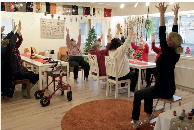
Hopeatuvalla on monenlaista toimintaa, myös jumppatuokioita.

Keskitalon yhteisöllisen asumisen huoneistot on remontoitu, ja kaikissa on oma wc- ja suihkutila sekä kahdessa huoneistossa on oma keittiö.