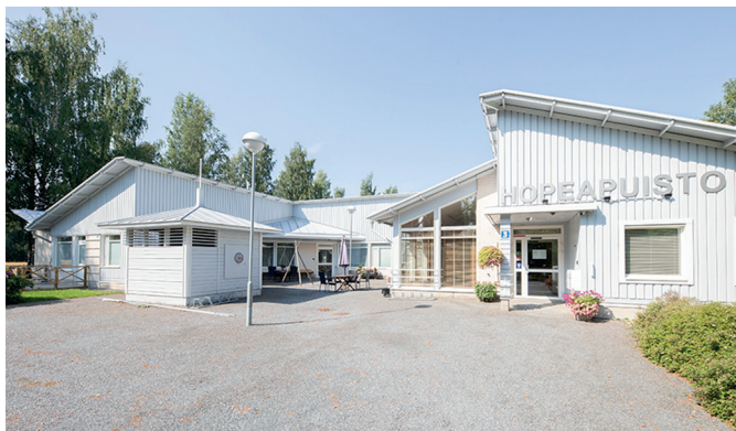
Hopeapuisto koostuu kahdesta rakennuksesta (3,4). Tutustu toimintaan katsomalla video nettisivuillamme tai YouTubeissa hakusanalla: Hopeapuiston esittelyvideo 2024.