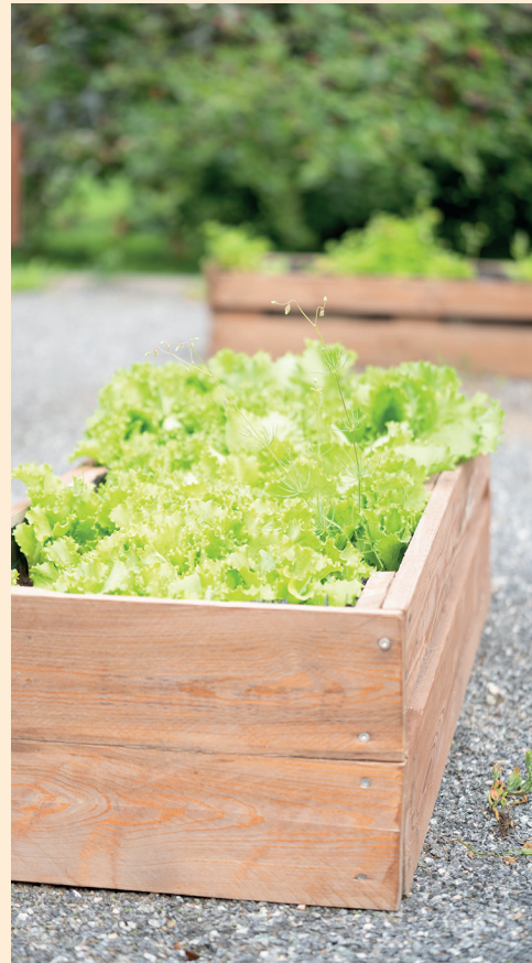
Laatikkopuutarhassa kasvatamme salaatteja, kasviksia ja yrttejä.