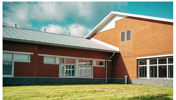
Hopeasylin toiminta Harjavallassa käynnistyy keväällä 2026. Palvelukodin tilat on remontoitu nykyajan vaatimusten mukaisiksi.

HoviAkademian tavoitteena on tukea hovikotilaisten ammattitaitoa, palvelutyön osaamista ja mahdollistaa hyvien käytäntöjen leviäminen. HoviAkatemian avulla pystymme vastaamaan asiakkaillemme antamaan palvelulupaukseemme ”Sinulle omaa elämää”.