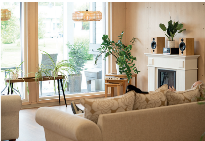
Hopeaharjun uuden päärakennuksen sisäntulon yhteydessä oleva yhteistila.