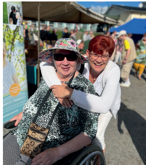
Asiakkaamme omahoitajan kanssa Noormarkun markkinoilla.

Video-valokuvaaja on käynyt kuvaamassa toimintaamme, olemme saaneet uutta kuva- ja videomateriaalia esitteiden ja verkkosivustojen käyttöön.