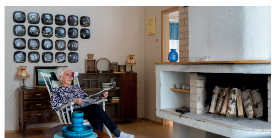
Yhteisten tilojen viihtyisä takkahuone palveluasumisen puolella

Vuoden 2022 aikana on Hopeapuistossa tarkoitus avata kuntouttava päivätoiminta ja ruokailumahdollisuus ulkopuolisille kävijöille. Tarkoituksena on tukea kotona asuvan ikäihmisen toimintakykyä ja sosiaalisia taitoja, antaa onnistumisen elämyksiä sekä auttaa selviytymään omassa kodissa mahdollisimman hyvin ja pitkään. Tavoitteena on myös tukea läheisen jaksamista tarjoamalla omaishoitajalle hengähdystauko.